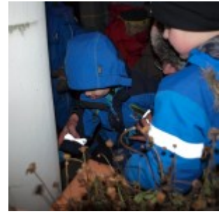
Pétur Berg kveikir á ljósunum.