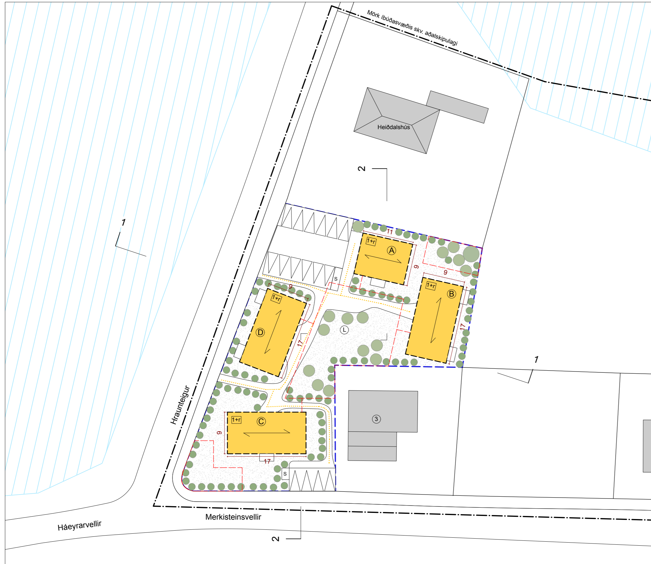
Deiliskipulagsuppdraottur, mkv. 1:500