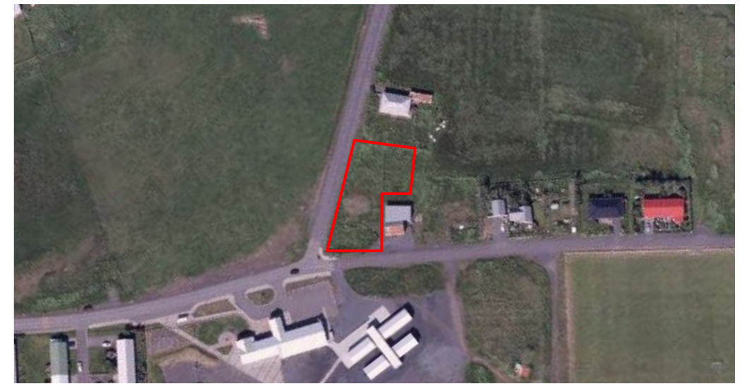
Staðsetning lóðar - núverandi ástand