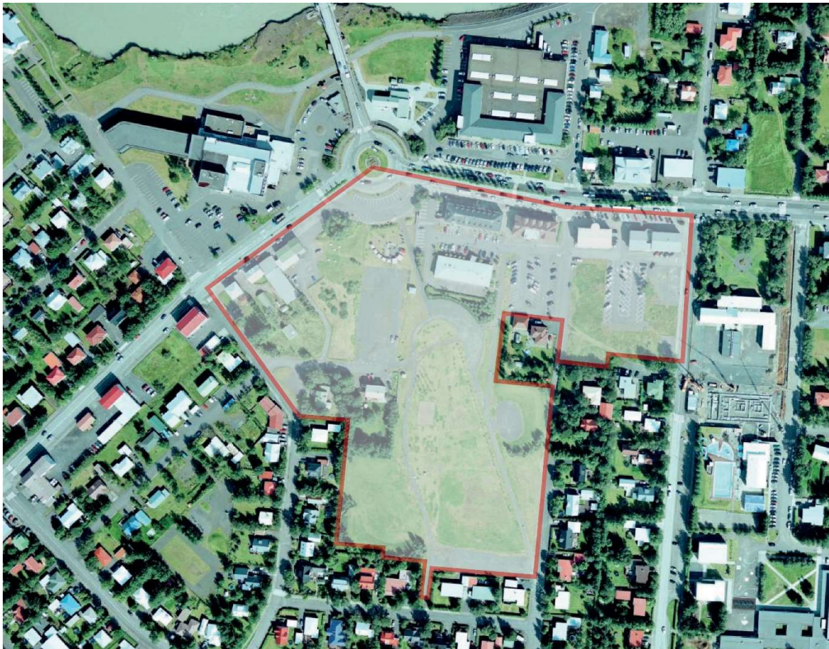
Mynd 1. Afmörkun skipulagssvæðisins.

Skipulagssvæðið er alls um 6,5 ha að flatarmáli.