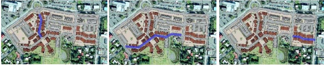
Mynd 4. Þrjár nýjar vistgötur liggja um skipulagssvæðið