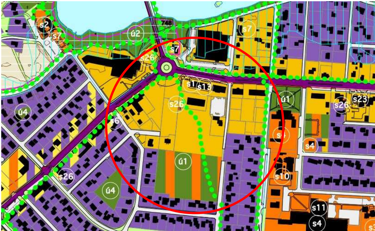
Mynd 2. Hluti aðalskipulags Sveitarfélagsins Árborgar, Selfoss, 2010-2030.