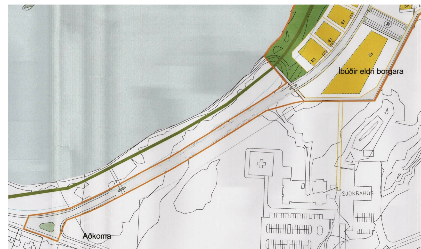
GILT DEILISKIPULAG FYRIR ÁRBAKKA SAMÞYKKT Í BÆJARSTJÓRN 13. JÚNÍ 2007, 1:2000