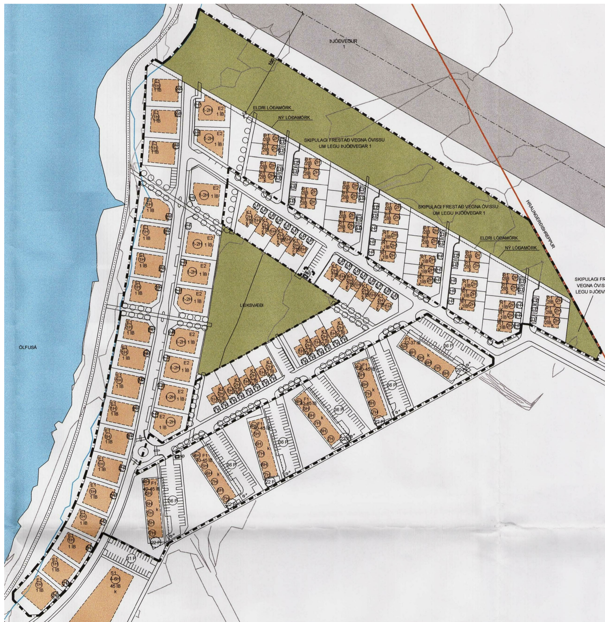
GILT DEILISKIPULAG FYRIR ÁRBAKKA SAMÞYKKT Í BÆJARSTJÓRN 24. JÚLÍ 2008, 1:2000