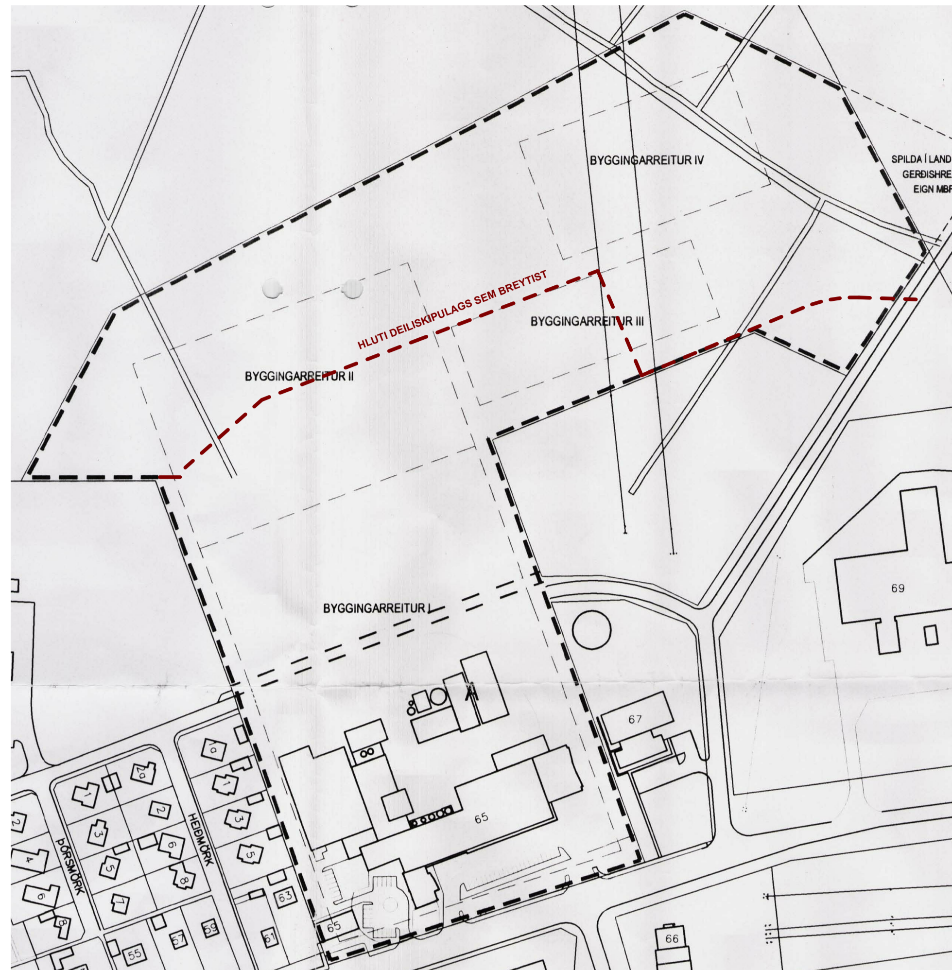
GILT DEILISKIPULAG FYRIR AUSTURVEG 65 SAMÞYKKT Í BÆJARSTJÓRN 12. JANÚAR 2005, 1:2000