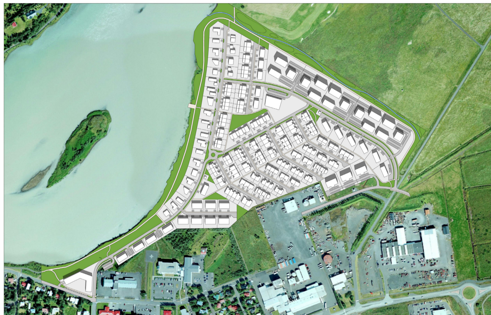
20. JÚNI - KL. 12:00