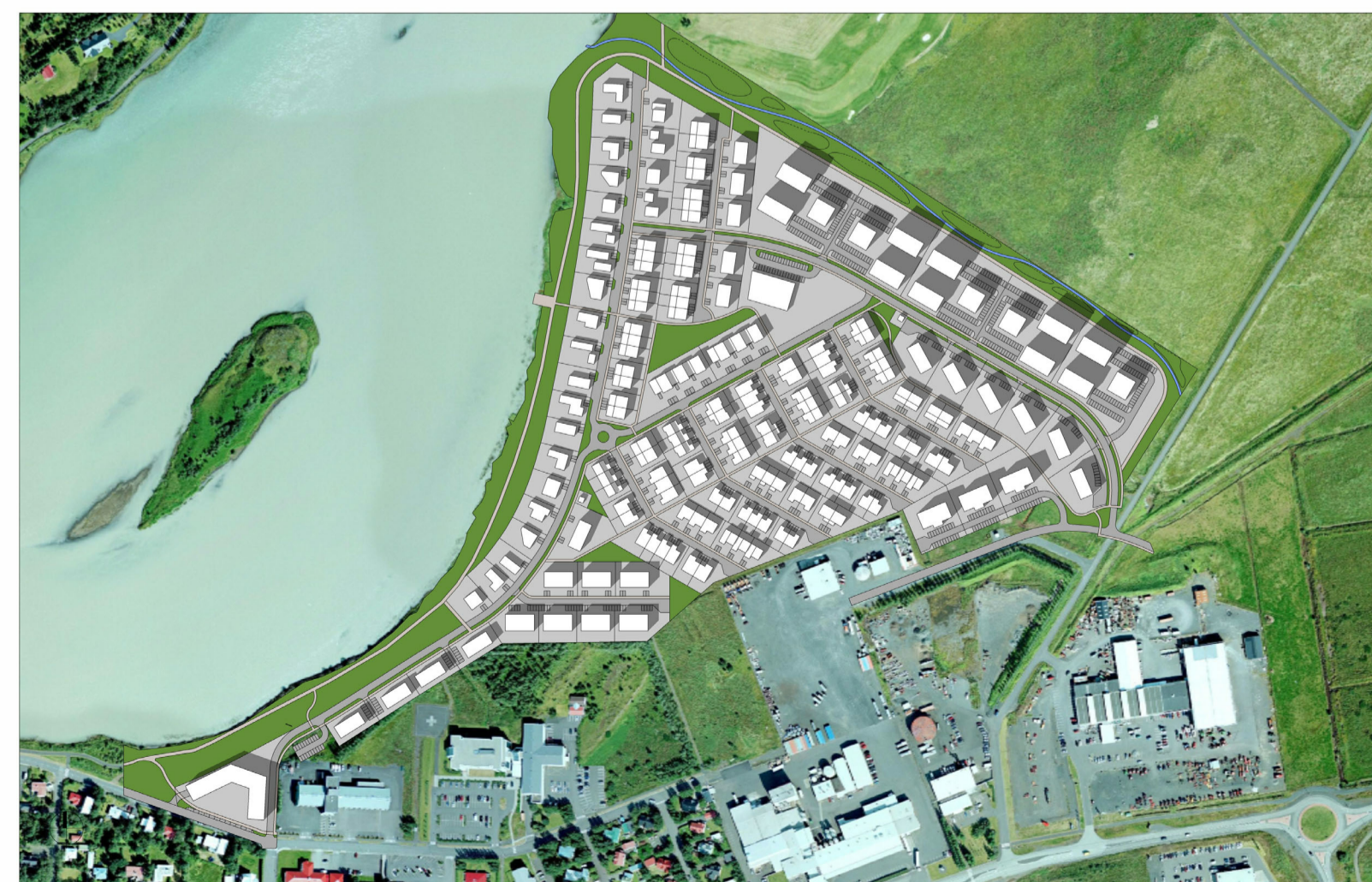
20. ÁGÚST - KL. 15:00

Deiliskipulagsbreyting þessi sem fengið hefur meðferð í samræmi við ákvæði 1. mgr. 43. gr. skipulagslaga nr. 123/2010 var samþykkt í skipulagsnefnd þann _____ 20__ og í bæjarstjórn þann _____ 20__ Tillagan var auglýst frá _____ 20__ með athugasemdafresti til _____ 20__.