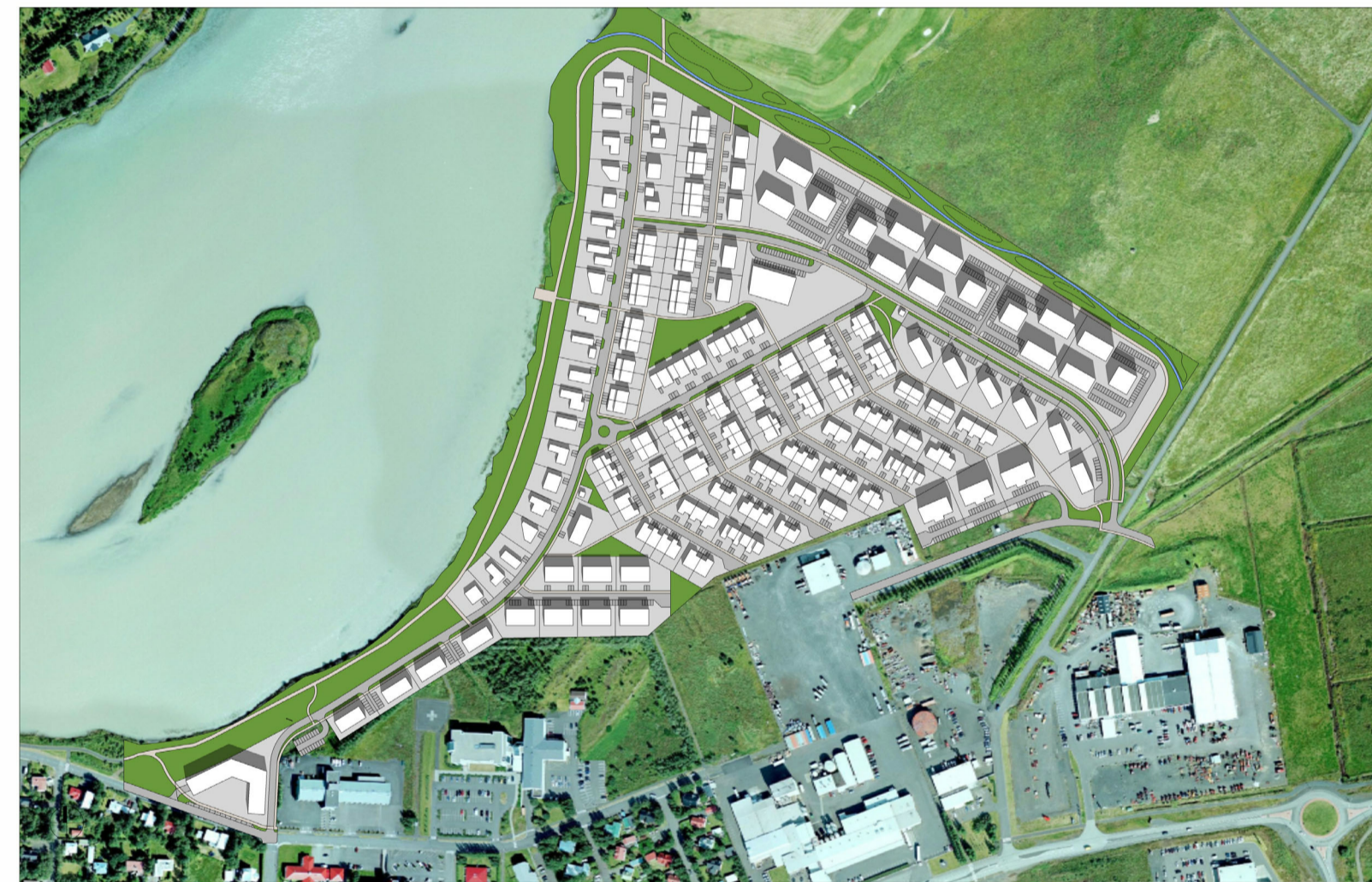
20. ÁGÚST - KL. 12:00