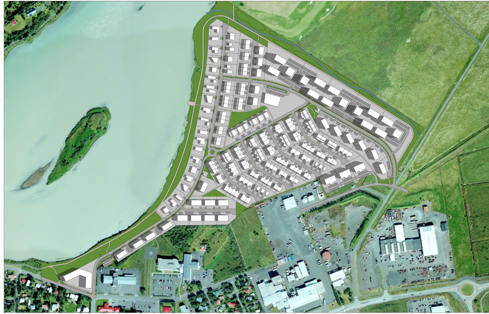
20. JÚNI - KL. 08:00