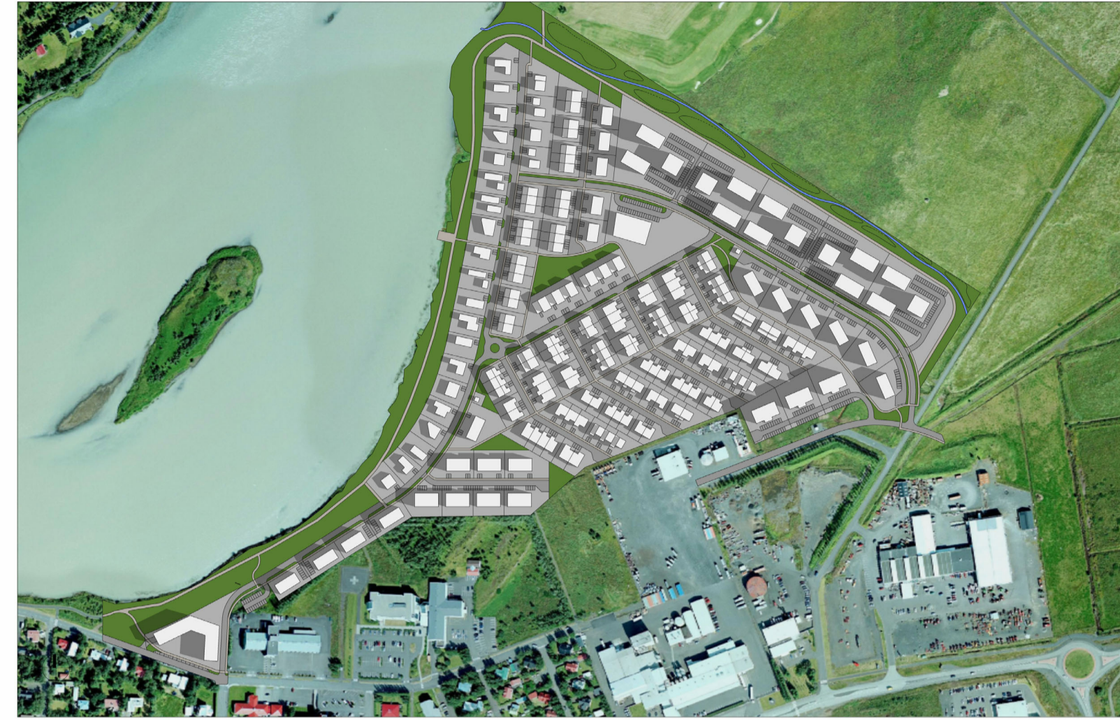
20. ÁGÚST - KL. 08:00