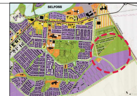
Aðalskipulag Árborgar 2010-2030