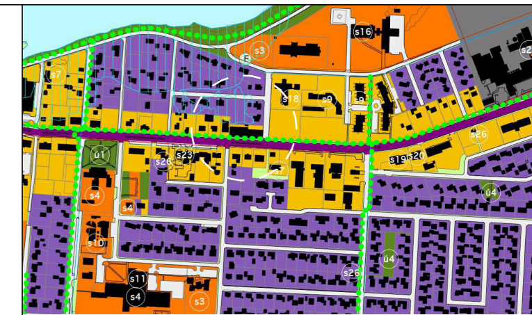
Hluti aðalskiplags Árborgar 2010-2030