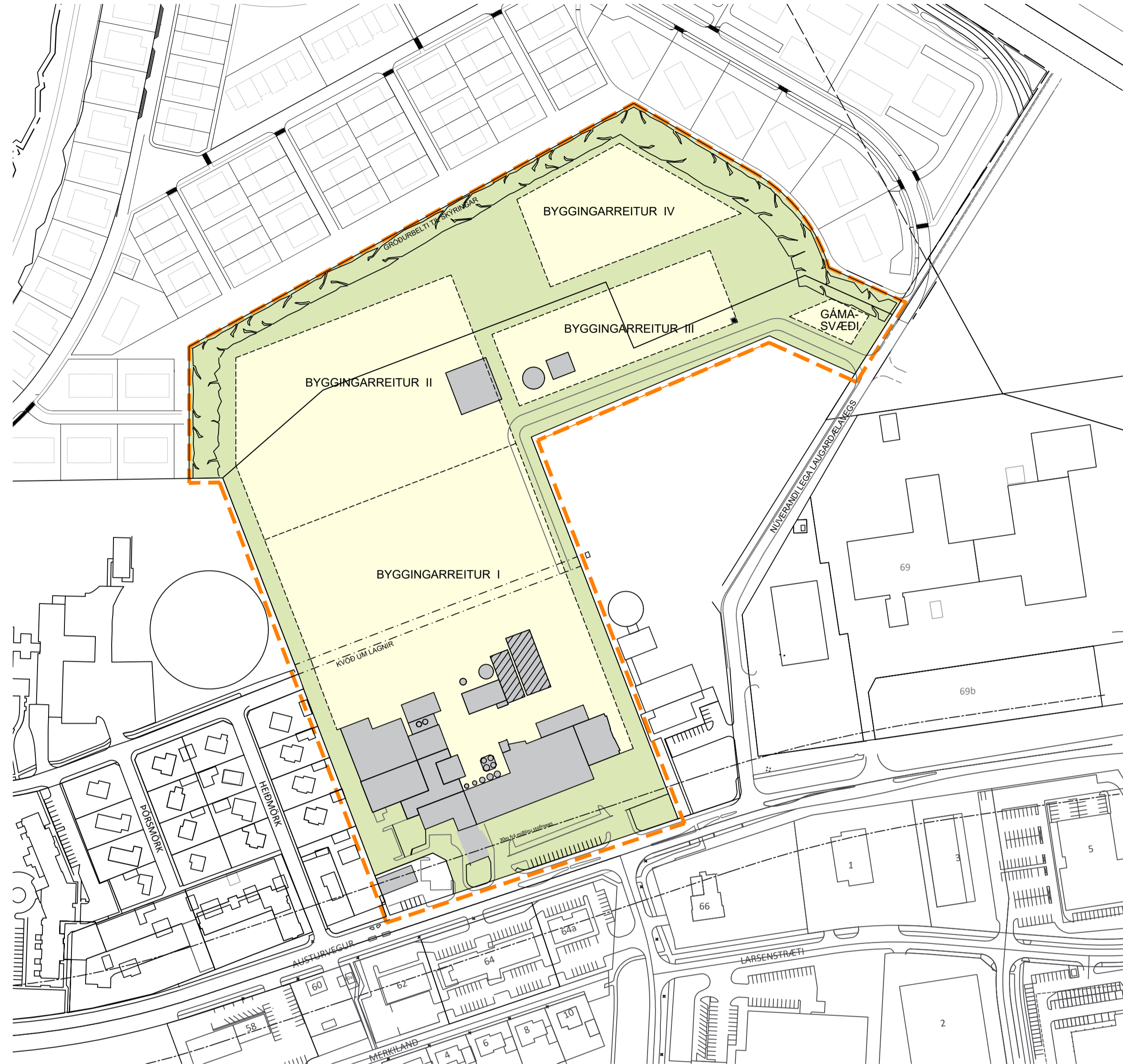
Deiliskipulag í gildi, samþykkt 12. janúar 2005 1:2000