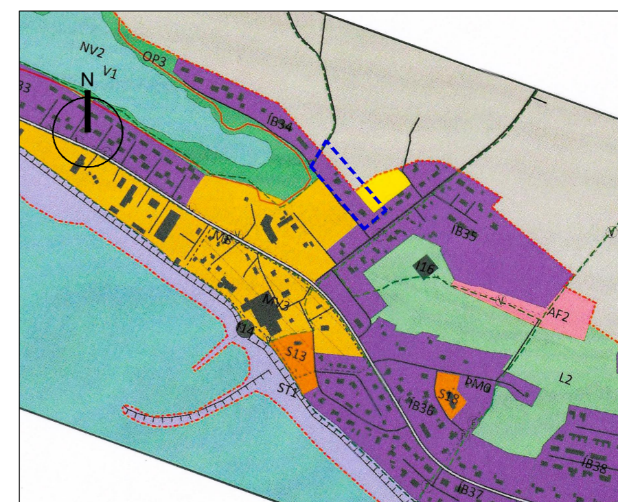
Skipulagssvæðið sýnt á þéttbýlisupprætti aðalskipulags. Mkv. 1:10.000