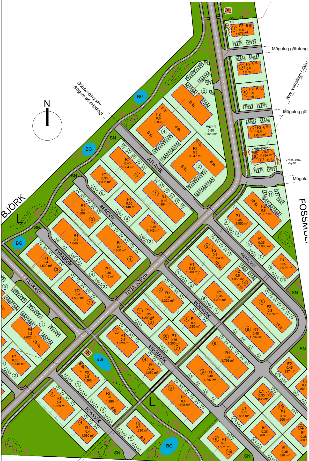
Yfirlitsmynd - Fyrir breytingar

Aðalskipulag Árborgar 2010-2030, hluti þéttbýlisuppráttar fyrir Selfoss með áörðum breytingum