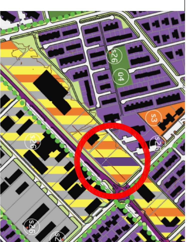
ADALSKIPULAG ÁRBORGAR 2010-2030 MYND EKKI Í KVARDA

DEILISKIPULAG ÞETTA, SEM AUGLÝST HEFUR VERIÐ SAMKV/EMT 41.GR. SKIPULAGSLAGA NR.123/2010 VAR SAMÞYKKT AF BÆJARSTJÓRN ÁRBORGAR