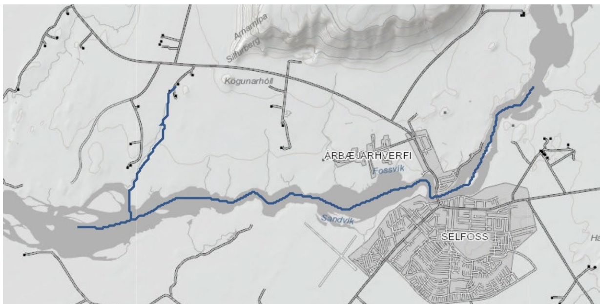
Mynd 5 – Vatnasvið Ölfusár 1, úr kortasjá Vatnamála.

https://vatnavefsja.vedur.is/#/waterbody/103-975-R