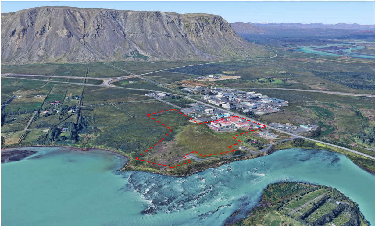
Mynd 1. Yfirlitsmynd úr þrívíðu módeli Google Earth, séð til norðurs. Rauð brotin lína sýnir gróf mörk skipulagsreits

Núverandi byggingarmagn innan deiliskipulagsreitsins er samtals 4.565,2 m 2 skv. fasteignaskrá. Elsta hús sláturfélagsins er frá 1946 en önnur hús eru byggð síðar í kringum 1970-1977 og síðustu viðbyggingar eru frá 2013.