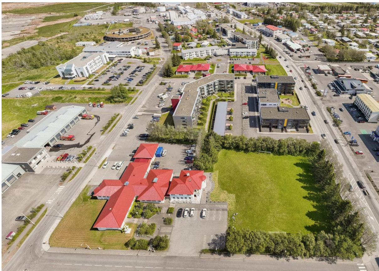
MYND 2. Horft frá Hörðuvöllum til austurs yfir skipulagssvæðið.

Hugmyndir eru um betri nýtingu lóða við Grænumörk og jafnvel víðar í hverfinu. Allar lóðir eru byggðar, ýmist einbýlishús á 1-2 hæðum eða fjölbýlishús á 2-4 hæðum. Sveitarfélaginu þykir hafa tekist vel til með þá þéttingu byggðar sem gerð hefur verið á nokkrum lóðum innan svæðisins á undanförunum árum, þ.e. fjölgun lóða og íbúða. Ekki er heimild í aðalskipulagi til meiri uppbyggingar á þessu svæði en vilji er hjá sveitarfélaginu að bæta nýtingu svæðisins, einkum á lóðunum Grænumörk 1 og 3.