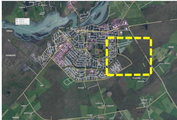
Mynd 1. Yfirlitsmynd – Afmörkun svæðis aðalskipulagsbreytingar. (map.is, 2019).

Aðalskipulagsbreytingin nær til íbúðarsvæðis (N13) sunnan hesthúsasvæðisins og austan við Austurhóla sem liggur frá Langholti að Suðurhólum.