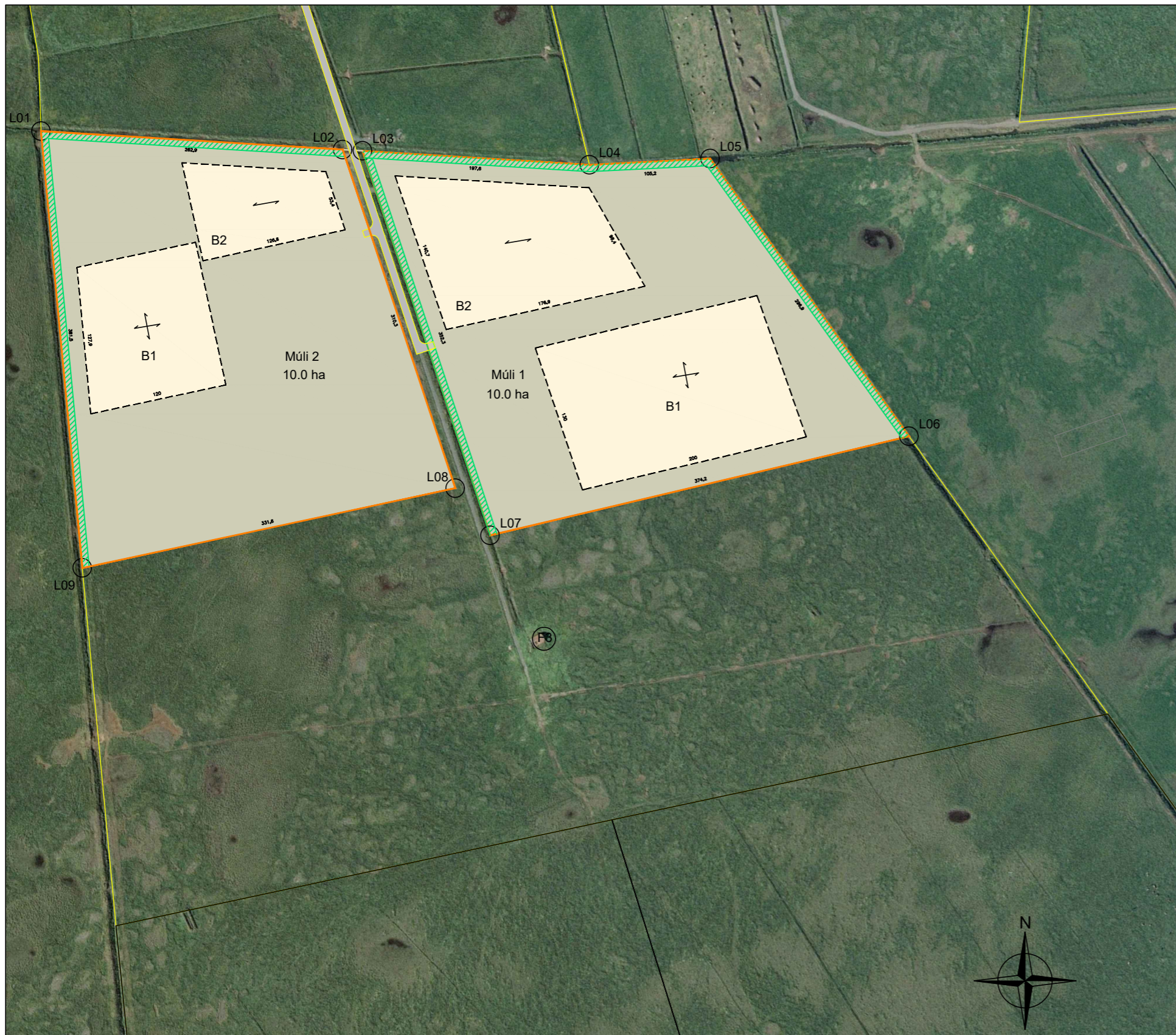
DEILISKIPULAG MKV. 1: 2.500

Samþykkt deiliskipulag var auglýst í B-deild Stjórnartíðinda ___/___/2024___