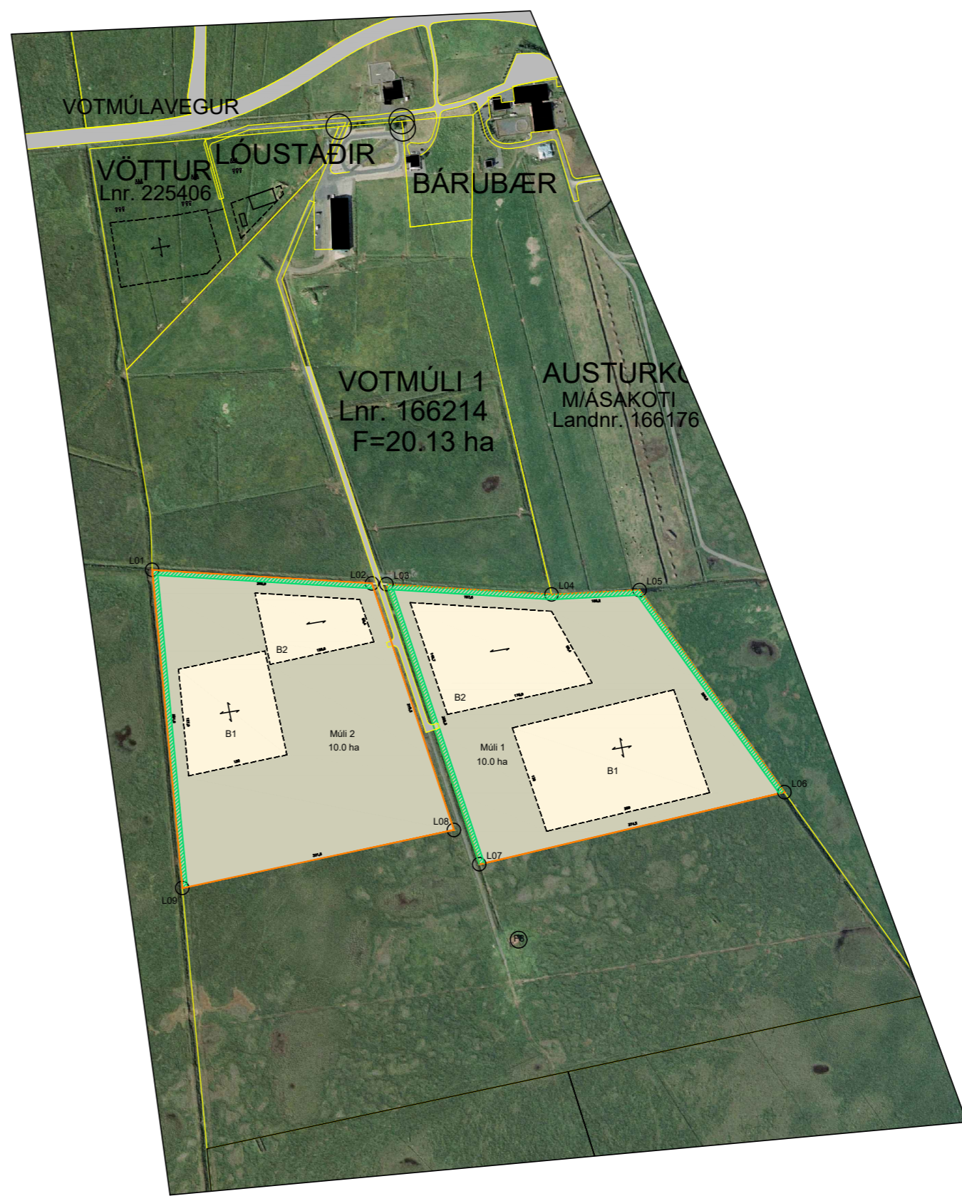
AFSTÖÐUMYND EKKI Í KVARÐA