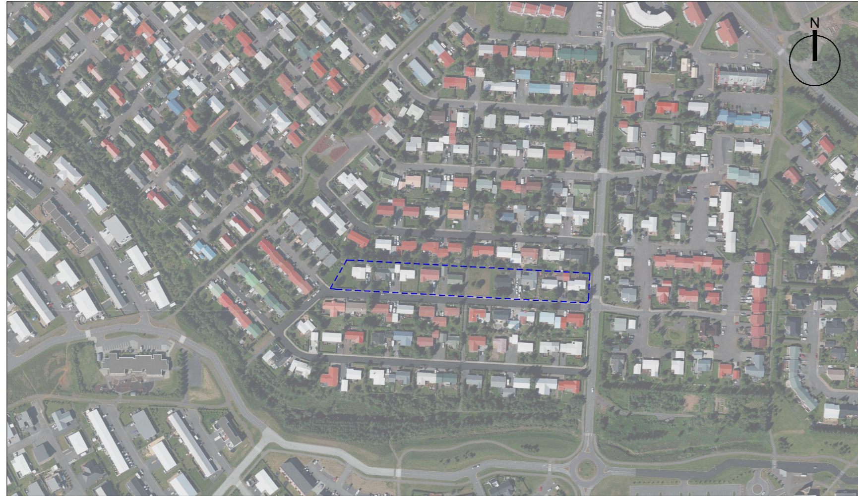
Skipulagssvæðið sýnt á loftmynd af Engjahverfinu og næsta nágrenni. Mkv. 1:4000