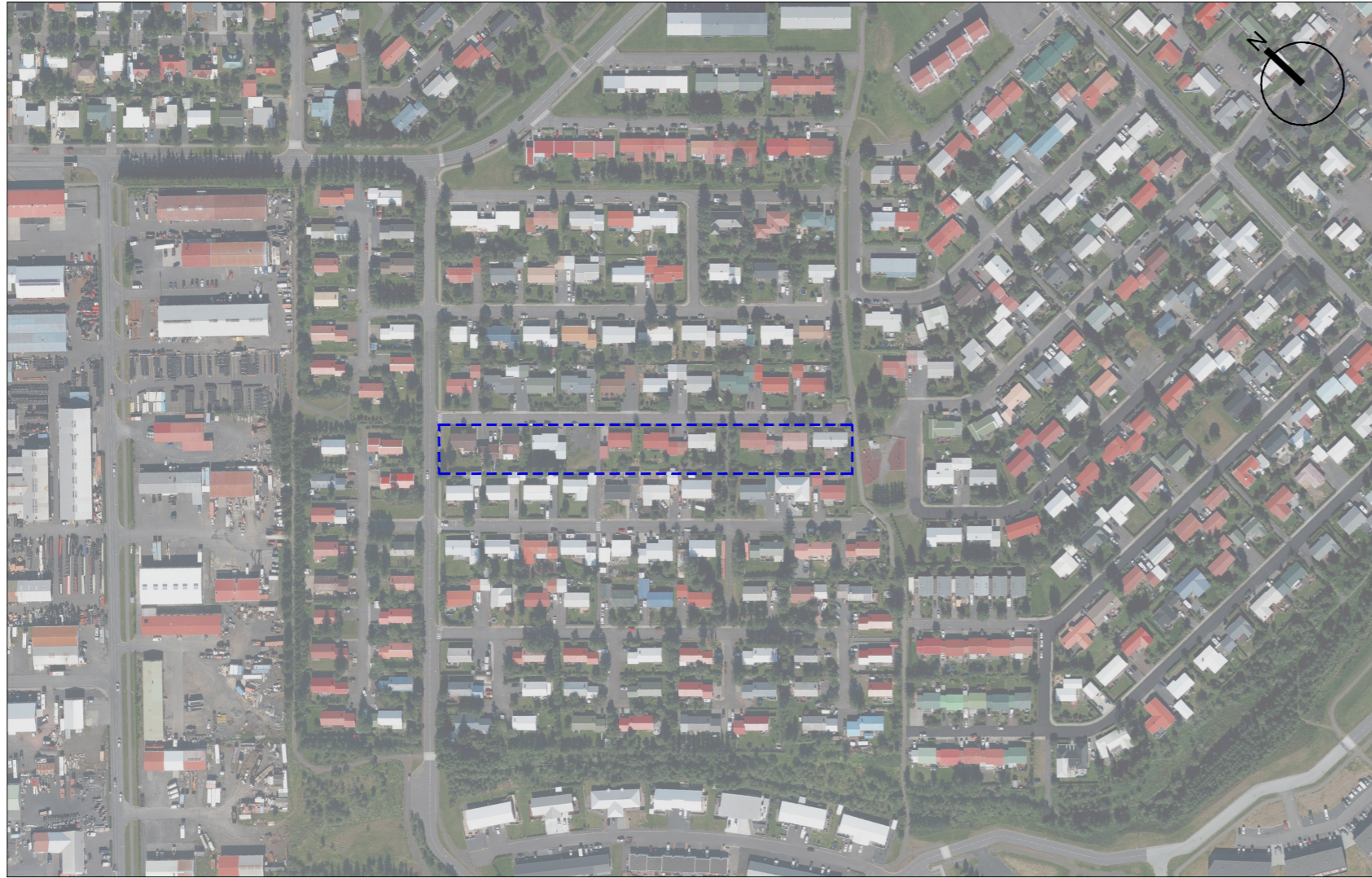
Skipulagssvæðið sýnt á loftmynd af Hagahverfinu og næsta nágrenni. Mkv. 1:4000