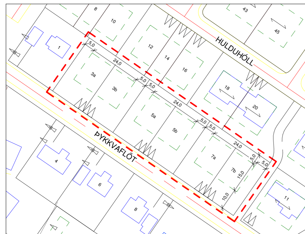
Deiliskipulag eftir breytingu 1 : 1000

- Núgildandi deiliskipulag við Hulduhól á Eyrarbakka, fyrir lóð Þykkvaflöt 9, deiliskipulag lóðar samþykkt 9.2.2005 af Bæjarstjórn Árborgar.