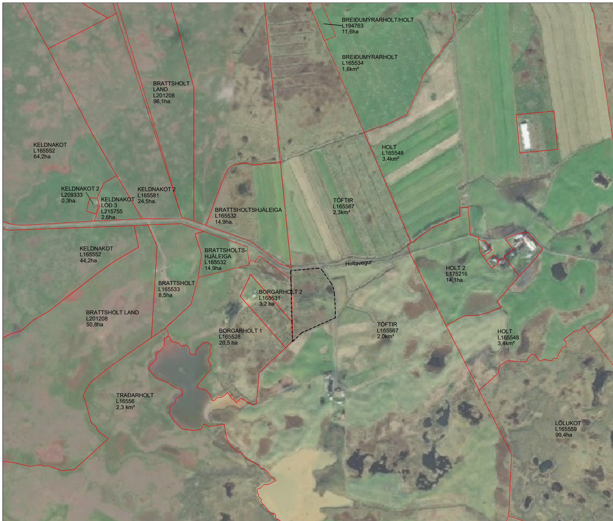
Skýringamynd, skipulagssvæðið og nærliggjandi svæði, mkv. 1 : 10.000

Deiliskipulag þetta hefur verið auglýst skv. 1.mgr. 41.gr. skipulagslaga nr. 123/2010 var samþykkt í bæjarstjórn Árborgar.