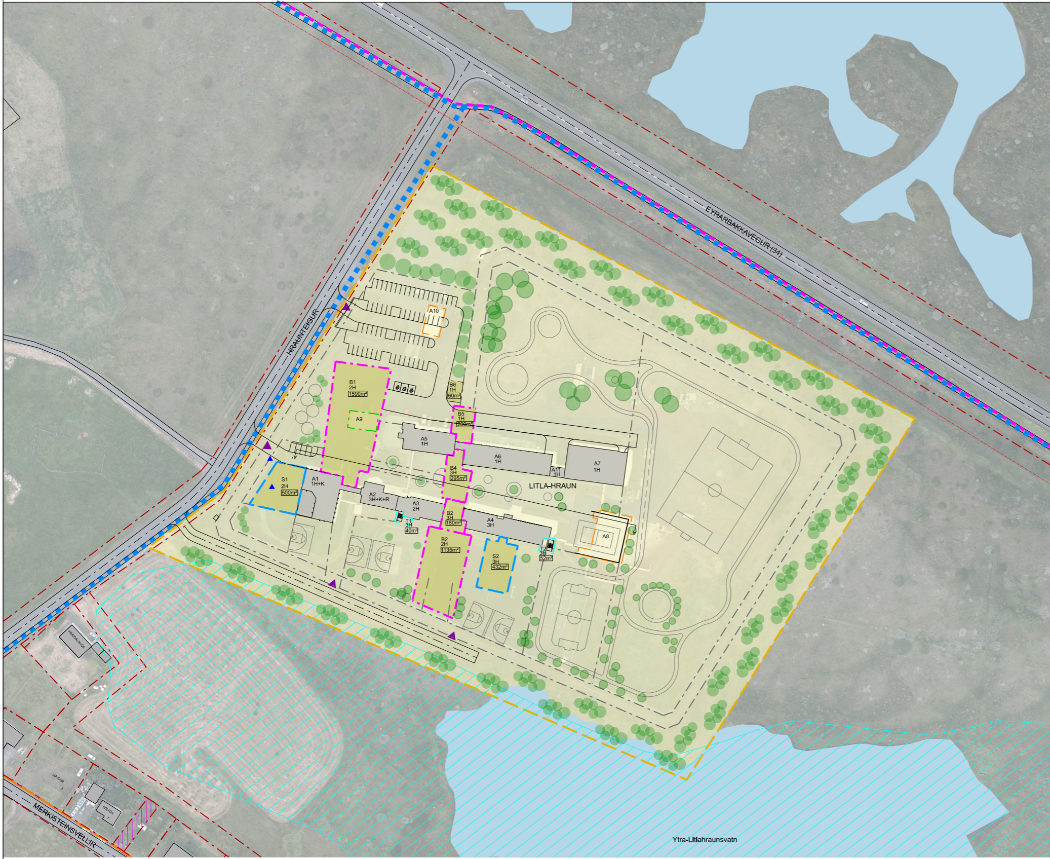
DEILISKIPULAGSUPPDRÁTTUR Mkv. 1:1000

ÁSYNDARMYND - NÚVERANDI BYGGINGAR HVÍTAR OG NYBYGGINGAR APPELSINUGULAR