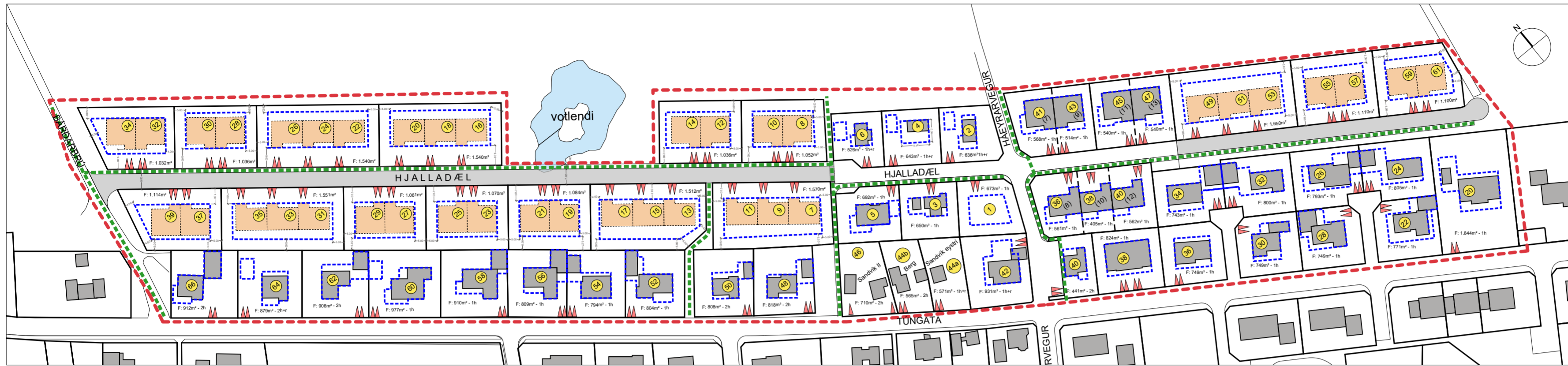
Deiliskipulagsuppráttur - mkv. 1:1500