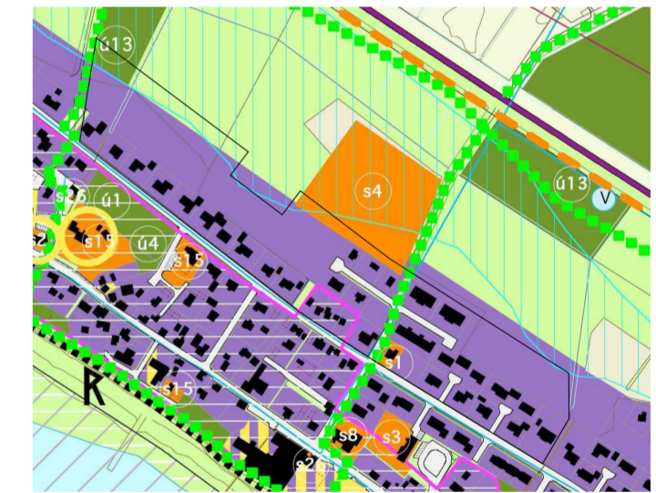
Úr aðalskipulagi Árborgar 2010 - 2030 - ekki í kvarða

Uppdráttur þessi er teiknaður í hnitakerfinu ISN93 og byggir á uppréttri loftmynd frá Loftmyndum ehf.