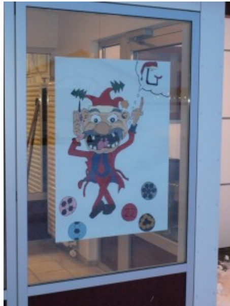
22. des. Ungmennafélag Selfoss, Tíbrá – Selfossvelli Bókstafurinn: G