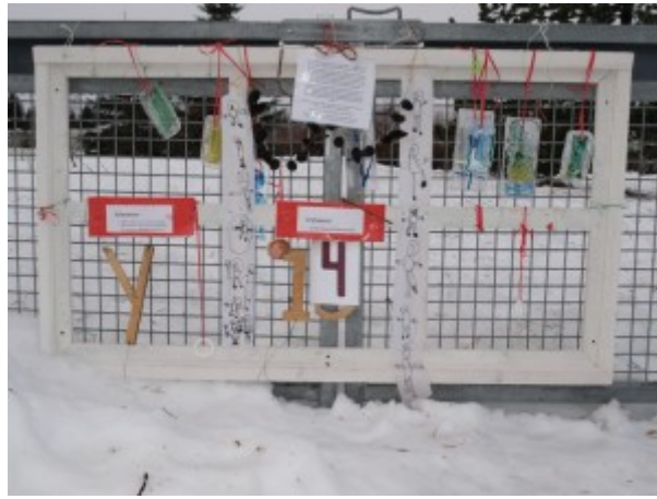
14. des. Leikskólinn Álfheimar Bókstafurinn: Ý