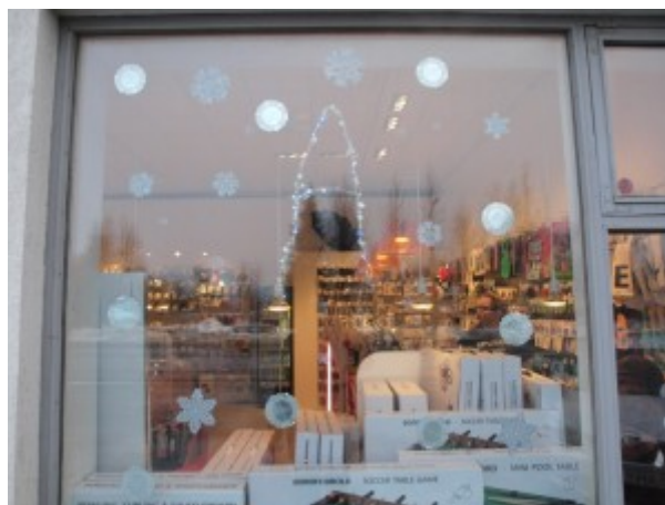
15. des. Tiger-Selfossi Bókstafurinn: A