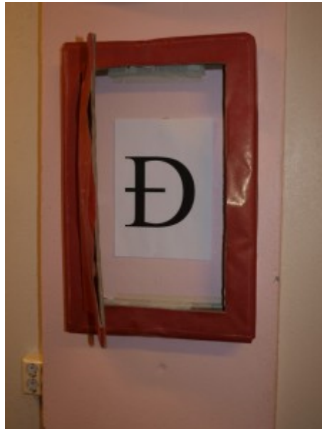
12. des. Ísbúðin Huppa Bókstafurinn: Ð