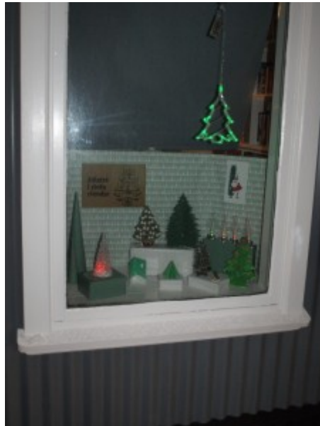
13. des. Laugabúð á Eyrarbakka, Eyrargata 46. Bókstafurinn: I