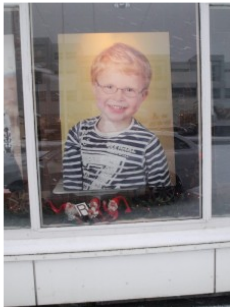
21. des. Stúdíó-Stund-Selfossi Bókstafurinn: R