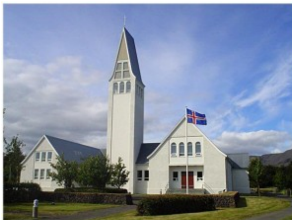
24. Selfosskirkja – utandyra Bókstafurinn: J

Gáta fyrir klára krakka úr jólagluggunum 2015 – ÞÁTTTÖKUEYÐUBLAÐ