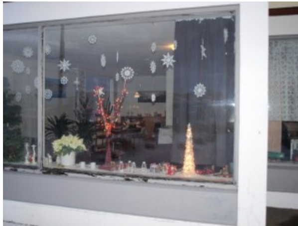
16. des. Sumarhúsið og garðurinn, Fossheiði 1, Selfoss Bókstafurinn: