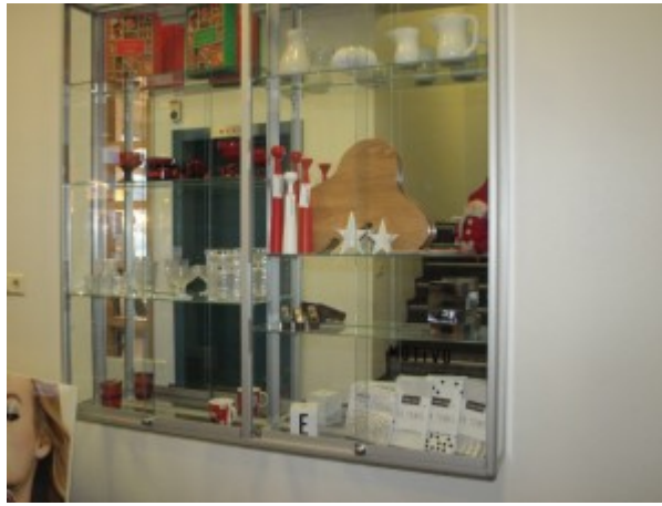
17. des. Verslunin Motivo, Austurvegur 9, Selfoss Bókstafurinn: E