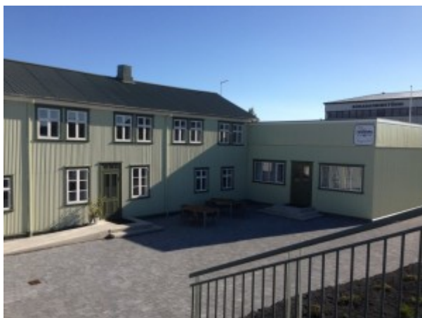
23. Veitingastaðurinn Tryggvaskáli Selfossi Bókstafurinn: Ó