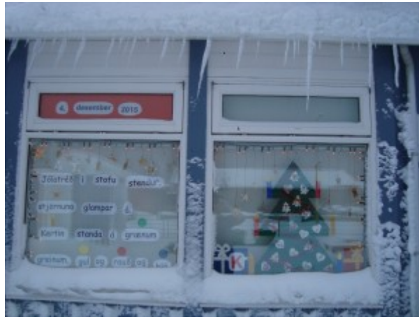
4. des. Leikskólinn Æskukot á Stokkseyri Bókstafurinn: K