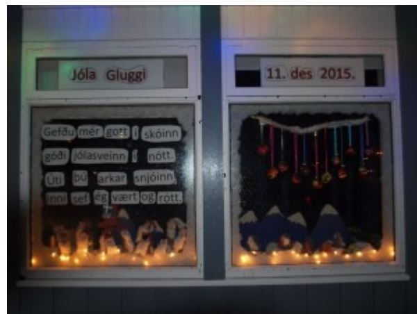
11. des. Leikskólarnir Brimver og Æskukot Bókstafurinn: Á