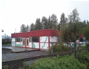
Kotið í Glaðheimum

Þátttakendur í 5. 6. og 7. bekk eru saman í starfi. Aðstaða þeirra er í Glaðheimum og er kölluð Kotið . Í starfinu er unnið að því að auka félagsfærni, samvinnu og góð samskipti í hóp. Unnið er í skipulögðu starfi sem og frjálsum tíma þar sem þátttakendur fá að velja sér verkefni