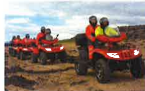
Úr einni af fjór hjólaferðum Hólaborgar

Allar frekar upplýsingar má finna á heimasíðu þeirra www.holaborg.com og í síma 664-8088